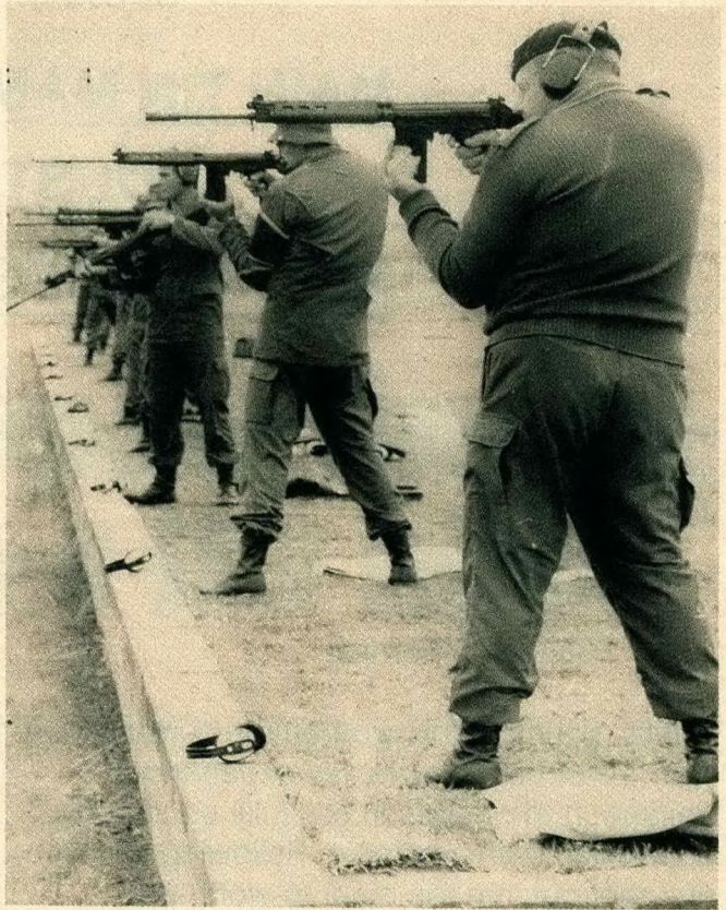
Members of Standerton Commando prepare to unleash a barrage of fire during the competition.