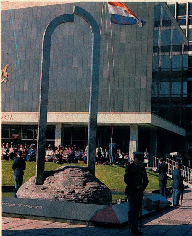
Die Triomfboog-gedenkteken in Pretoria en die groot skare wat die indrukwekkende gedenkdien vir terreurslagoffers bygewoon het. – (Foto: Bennie Booysen)

Die kapelane sou hul luitenantstrange ontvang voordat hulle na hul onderskeie eenhede vertrek het.