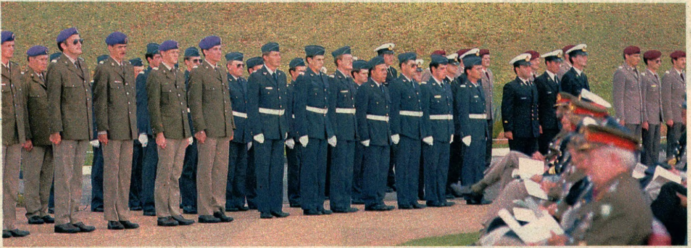
Nuwe diensplig-kapelane van al vier die Weermagsdele tydens hulle voorstellingsparade op Fort Klapperkop.