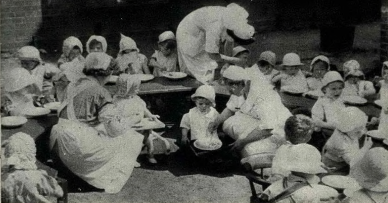
Klein kindertjies eet in die tuine terwyl hulle ouers oorlogswerk doen.

2. DIE JAARLIKSE UITGAWE AAN MAATSKAPLIKE dienste in Brittanje het gestyg van 15/- (vyftien sjielings) per hoof van die bevolking in 1890 tot £10 in 1936.