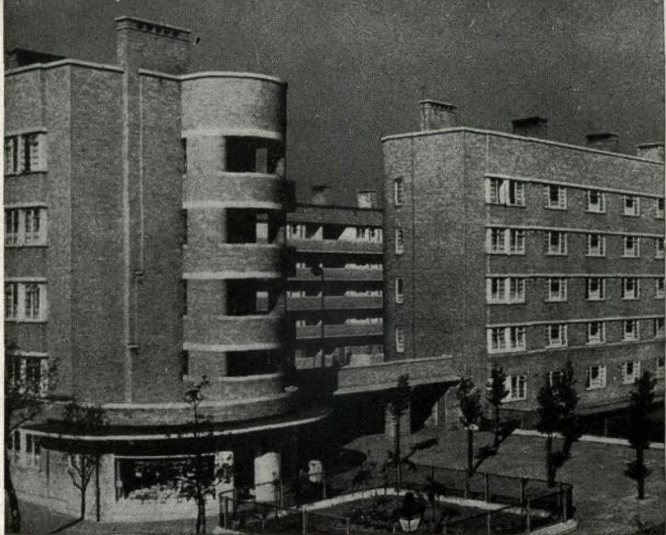
Werkers-kamerwonings in Liverpool, voorsien van sonlig, winkels en tuine,

tuin het en daar nooit meer as twaalf huise per akker gebou word nie.