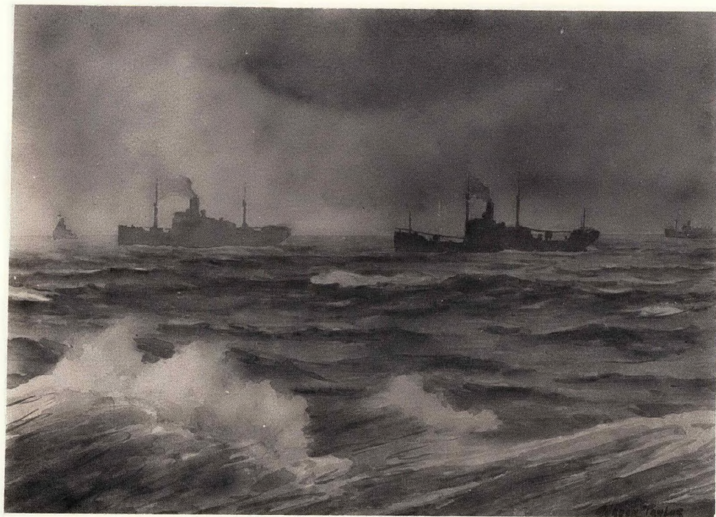
„Konvooi in die reën” “Convoy in the Rain”