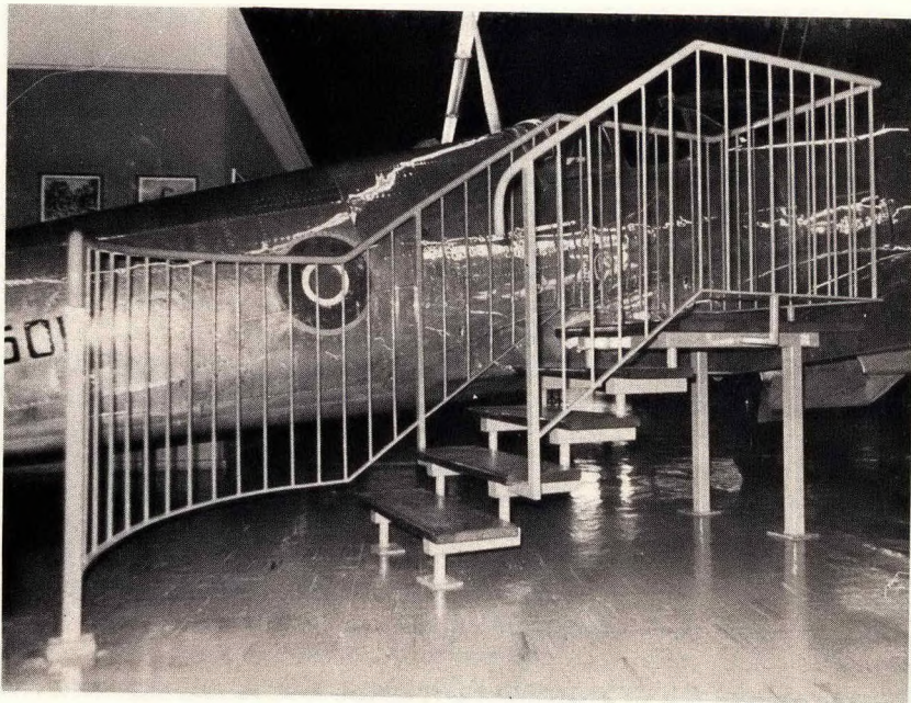
Besigtigingsplatform wat langs die Spitfire vliegtuig aangebring is. Viewing platform erected alongside the Spitfire aircraft.