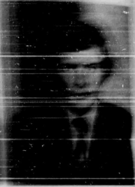
Mr. J. J. [Name]