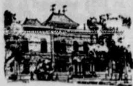
Februarie Hooggeregshof, Pietermaritzburg