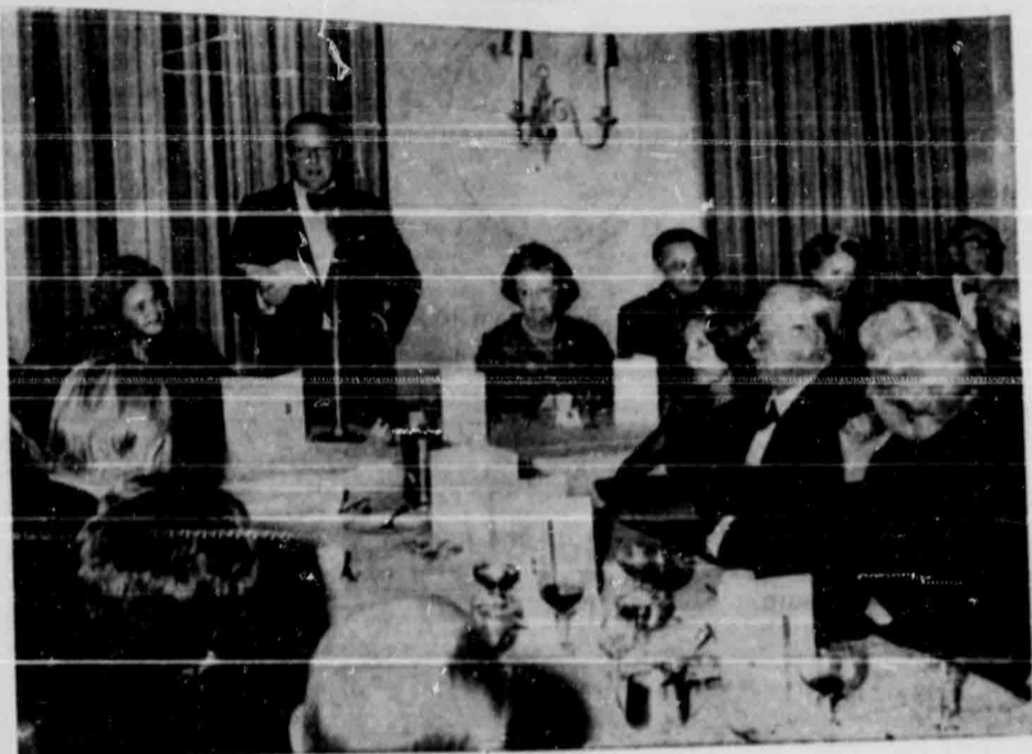
Die Minister van Justisie, mnr J T Kruger, aan die woord.

die hoogste peil moet wees, het die Minister gesê. Voortspruitend uit die verslag van die komitee van ondersoek na die registrasie van aktes word wetgewing beoog ingevolge waarvan aansienlik groter verantwoordelikheid op die skouers van die prokureur geplaas sal word. Mnr Kruger het gesê dat hy nie nou ingaan op wat die verantwoordelikheid presies behels nie, maar dit was treffend dat toe die prokureursberoep daarvoor genader is, dit dadelik laat blyk het dat dit bereid is om die uitdaging te aanvaar. "Met so 'n gesindheid is ek oortuig dat die veranderinge 'n sukses sal wees. Die aanvaarding deur die beroep van 'n groter verantwoordelikheid met betrekking tot sekere aangeleenthede sal 'n groot verligting in aktekantore meebring." Die dokumente wat nagegaan moet word, sal aansienlik minder word, iets wat slegs kan lei tot die bespoediging van die registrasieproses. Dit sal ook lei tot 'n aansienlike besparing in bergings-