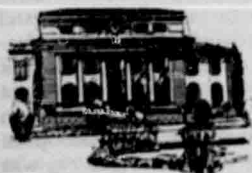
Maart Appèlhof, Bloemfontein

In die Maartuitgawe van De Rebus Procuratoriis het 'n advertensie verskyn waarin 100 genommerde afdrucke van Minette van Rooyen se sketse van hotgeboue aan prokureurs te koop aangebied word. Die reaksie was oorweldigend. Bykans 75% van die oplaag is reeds uitverkoop!