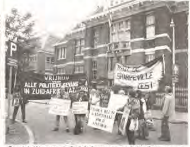
Een picketline voor de Luidaftikaanse ammansade Den Haar, juni ji.

De Sharpeville Zes zitten in december alweer 3 jaar in de dodencel. De strijd om hen van de galg te redden gaat nog steeds door. Al twee maal kregen ze uitstel van executie. Het wachten is nu op de uitspraak van een hoorzitting van het Hooggerechtshof van 7 september j.l., die bepaalt of de Zes alsnog een kans hebben op heropening van hun proces. Het draait daarbij om de bekentenis van een kroongetuige die zegt door de politie te zijn gemarteld en gedwongen tot het afleggen van belastende verklaringen tegen de Zes.