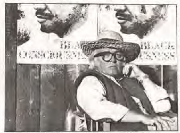
Richard Attembersouth ______witertainment on oon proof publish. ______

BIKO'S GEESTVERWANTEN AFKEUREND OVER DE FILM