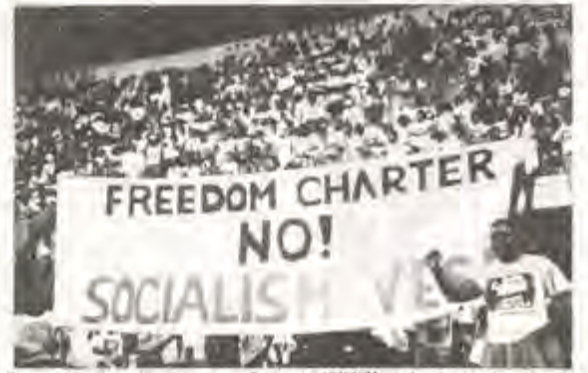
Het ondemokraties gemenipuleer ab CONSIA onder controle van het Freedom Charter te brengen lien stuk up den meerderheidsbesluit van de organisatie te tEreven naar een demokratiete bond en modralimme

Een meerpartijenstelsel in een onafhankeliik, onverdeeld, demokraties en nonraciaal Zuid Afrika. Hervorming van het instituut van erfelijke heersers en stamhoofden. Een landhervormingsprogramma ter afschaffing van raciale beperkingen op bezit en gebruik van het land. Een gemengde ekonomie met een door de staat begrensde prive-sektor. En het Freedom Charter in de grondwet. Dat zijn de hoofdingredienten van het toekomstig Zuid Afrika volgens de nieuwe versie van het Freedom Charter. Ten aanzien van de achtergronden en de betekenis hiervan verschillen in Zuid Afrika de meningen