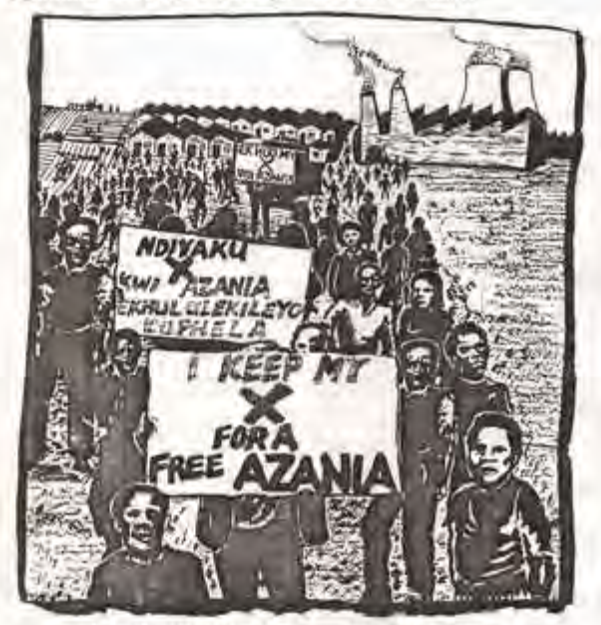
intiversidingsporter van de Cape Action League.

De noodtoestand en vele intimiderende maatregelen hebben niet kunnen voorkomen dat de onlangs gehouden verkiezingen voor de zogenaamde zwarte gemeenteraden massaal werden geboykot. Het percentage uitgebrachte stemmen bedroeg in Soweto bijvoorbeeld maar 4%. Het opkomstpercentage is nog veel lager. Hoe dat kan? Eenvoudig. Niet iedereen heeft dezelfde stemrechten onder Apartheid. Zwarten met geld hebben meer stemmen dan zwarten zonder geld. Het is een van die aparte dingen die door de internationale pers over het hoofd zijn gezien.