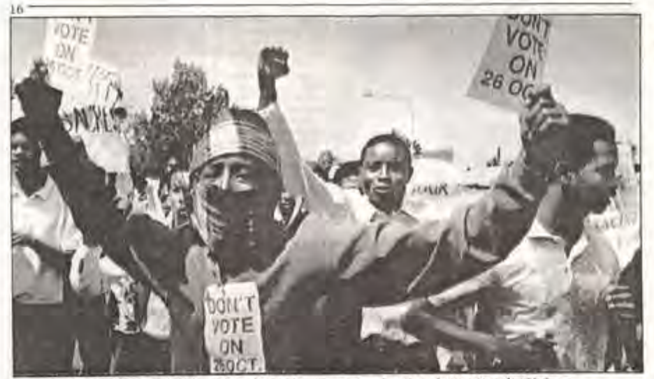
Zwarte studenten nan de Universiteit van Knapstad roepen op tot zen hoycot van de gemienternadiverklezingen