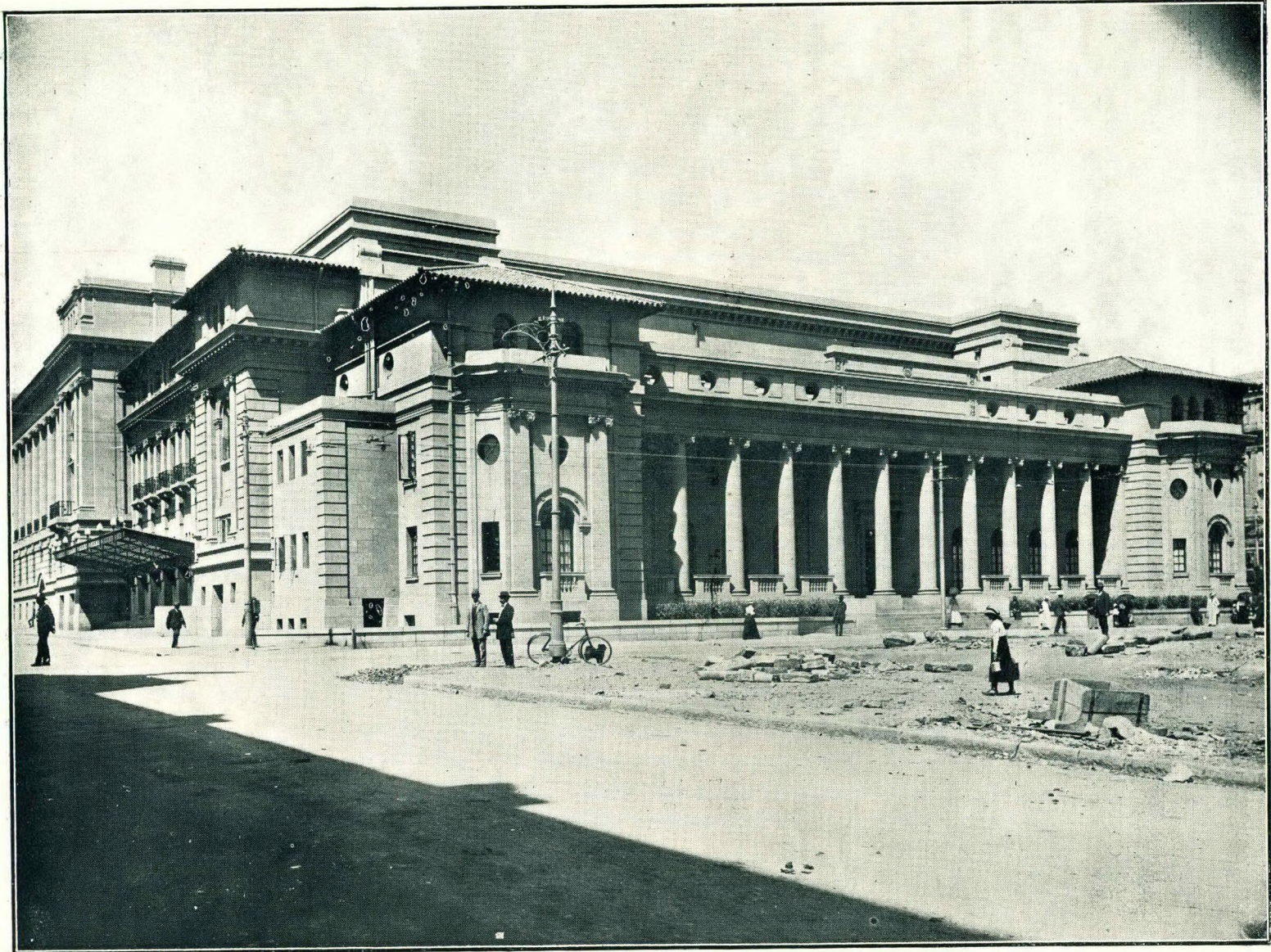
HARRISON STREET FRONT.