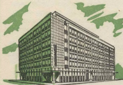
Toekomstige Hoofkwartier in die voorgestelde MACOSA-GEBOU (nou onder konstruksie), hoek van Commissioner- en Bezuidenhoutst., Johannesburg.

Die Mercantile Acceptance Corporation verleen waardevolle hulp in die ontwikkeling van talle industriële en kommersiële ondernemings. Onder meer bevorder die Korporasie die Suid-Afrikaanse tekstielbedryf deur groothandelaars in weefstowwe te finansier. Hulp word ook verleen vir die oprigting en ontwikkeling van fabriek asook finansiële steun vir sekere industriële huurkoop-ooreenkomste.